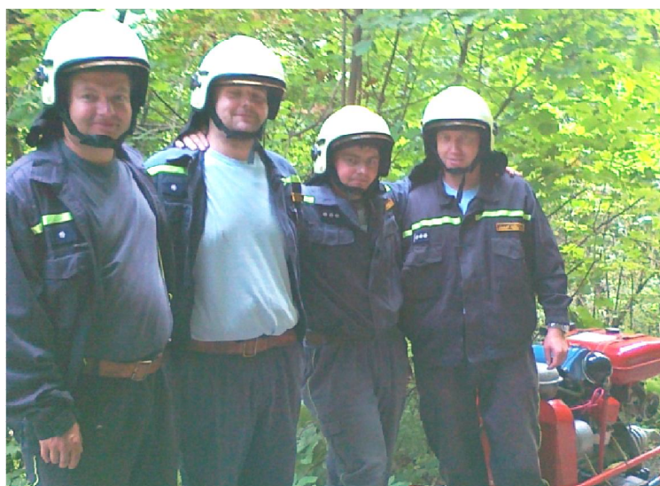
Cvičení dálkové dopravy vody v Lovčicích

Dalším soutěžním dnem byl 16. srpen 2014, kdy soupeřila hasičská mužstva ve Ždánicích. Zde se našim hasičům trochu nedařilo a skončili na 5.místě. Dne 6.9.2014 se naše jednotka zúčastnila mimořádného cvičení v Lovčicích. Cvičení se týkalo dálkové dopravy vody a bylo určeno pro 3. okrsek. Dálková doprava vody se již moc nevyužívá díky modernějším technologiím. Dříve byla určena pro dopravu vody ke vzdáleným požárům v nepřístupném terénu. Cvičení proběhlo dopoledne, odpolední program se uskutečnil i pro civilní diváky, kterým zde bylo předvedeno mnoho technického vybavení hasičských jednotek. Mimo jiné bylo možno vidět profesionální používání benzínových motorových pil, záchrana tonoucího z břehu i ze člunu, vyprošťovací techniky u autonehod a odtah vozidel autojeřábem. Dne 20.9.2014 jsme se zúčastnili netradiční noční požární soutěže pořádané SDH Želetice letos uskutečněnou v Archlebově. Zúčastnilo se 10 družstev dobrovolných hasičů. Soutěž byla netradiční v tom, že místo sestřelovacích terčů se hasí oheň. I přes vysokou účast a nápor komárů jsme skončili na krásném druhém místě. Na prvním místě se umístilo družstvo z Vracova.